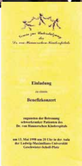
Einladung für ein Benefizkonzert zu Gunsten des Hauner Vereins 1998