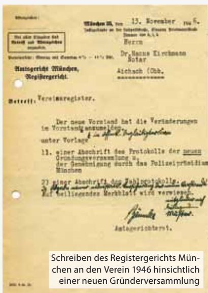
Schreiben des Registergerichts München an den Verein 1946 hinsichtlich einer neuen Gründerversammlung