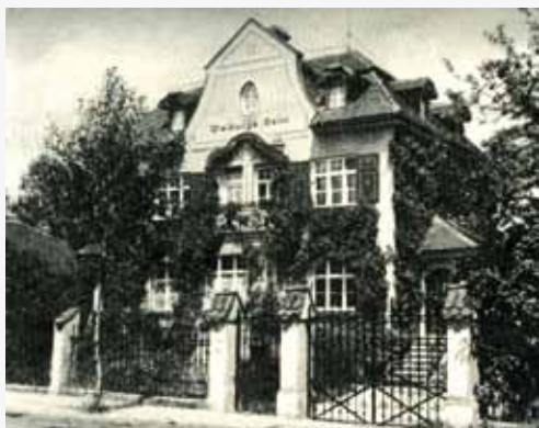
Das Walburgaheim in Emmering / FFB 1926 – 1956 Erholungsstätte für entlassene Kinder und Ausweichquartier in Kriegezeiten

(Aus einem Spendenaufruf des Vereins aus dem Jahre 1924: „Nach achtzigjährigem segensreichen Bestehen ist das Dr. von Haunersche Kinderspital nahe daran, seine caritative Aufgabe nicht mehr erfüllen zu können...Und doch soll da geholfen werden! Es muss daher alles aufgeboten werden, um jedes nicht nur den Eltern teure, sondern dem ganzen Volke wertvolle, ja unersetzliche Kinderleben zu erhalten...Eine Kleinigkeit im Jahre kann jeder geben. Der Arme sogar! Keiner schließe sich aus, weil er augenblicklich nicht so tief greifen kann wie früher...“)