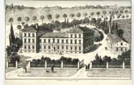
Der 1882 eingeweihte 1. Bauabschnitt des Haunerschen Kinderspitals an der Lindwurmstr. 4