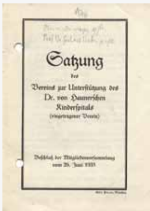
Deckblatt zur Vereinssatzung 1935

In den nun folgenden Jahrzehnten zwischen Mitte der 1950er und Mitte der 1980er Jahre verschieben sich die Schwerpunkte der Vereinsaktivitäten deutlich: während Ausgaben für Kleidung, Ernährung und Behandlung armer Kinder immer seltener notwendig werden, nimmt der Finanzierungsbedarf für Personal, das nicht von der Universität getragen wird, kontinuierlich zu. Zunächst sind dies insbesondere Erzieherinnen und Beschäftigungstherapeuten, die das Los langliegender oder operierter schwerkranker Patienten erleichtern, später auch Mitarbeiterinnen der Kinderbibliothek „Das fröhliche Krankenzimmer e.V.“ und psychosoziales Personal, Diplompsychologinnen/ Diplompsychologen, Sozialpädagoginnen / Sozialpädagogen.