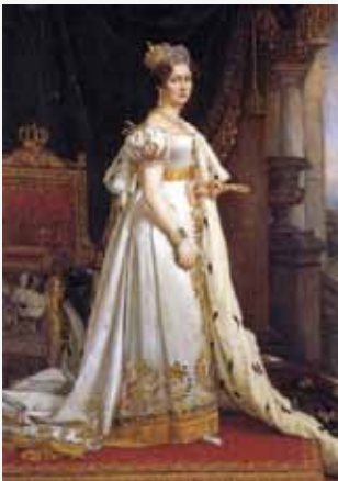
Königin Therese, Ehefrau von König Ludwig I. übernahm das erste Protektorat über den Verein